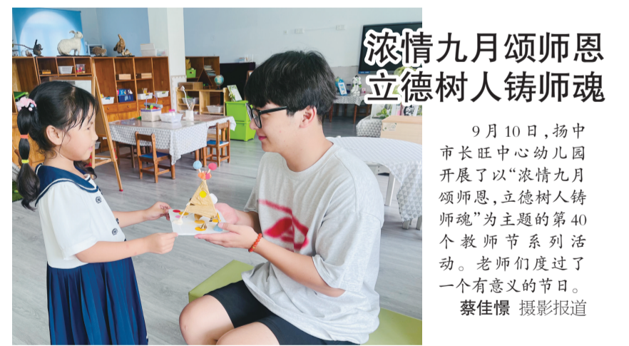
浓情九月颂师恩 立德树人铸师魂

近日,江科大附中组织开展“师德第一课”活动,全体党员、教职工进行了庄严的师德宣誓。