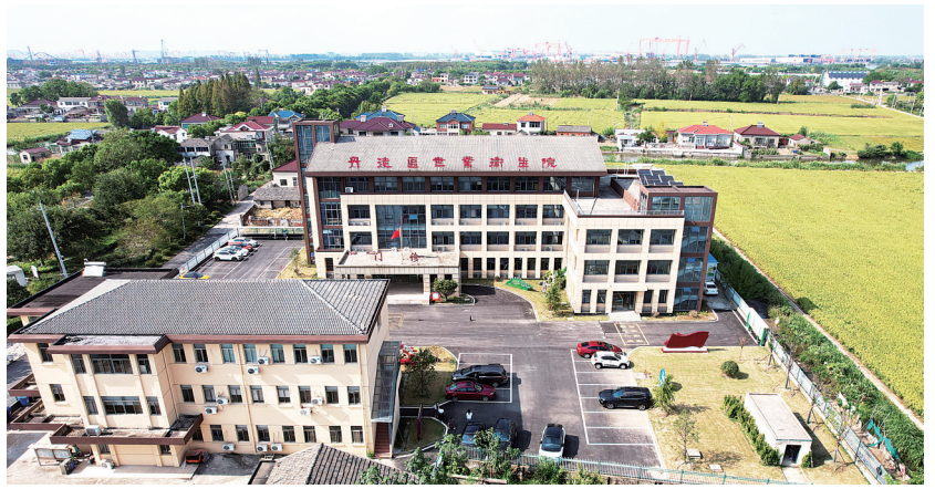
2024年9月世卫组织医院航拍图。