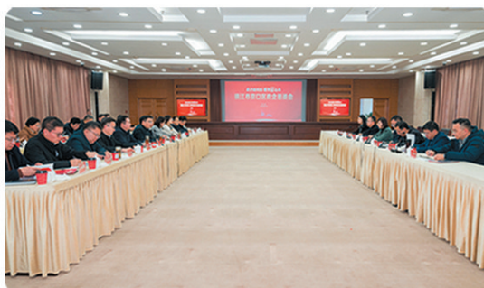
“政企面对面·服务‘京’心办”政企恳谈会