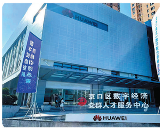
华为数字人才中心