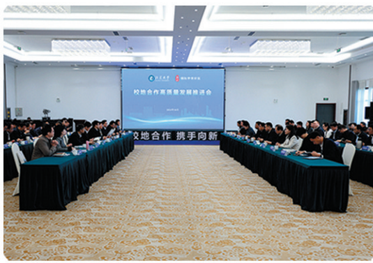
江苏大学与京口区校地合作高质量发展推进会

京口区铆足“咬定青山不放松”的钻劲韧劲,以超常规举措攻坚突破重大事项。举全区之力一步一个脚印,攻坚国能镇江多能互补一体化综合能源示范项目。紧盯镇江东货场迁建工程重大任务,依法依规高效推进全市集体土地房屋征收新政发布后首个搬迁项目,2个月实现100%签约、81天完成净地交付,创造了镇江市近年来土地组卷报批速度新纪录。