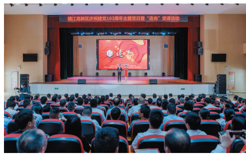
镇江高新区庆祝建党103周年主题党日暨“追光”党课活动成功举办。