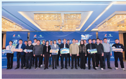
第八届“镇江高新区杯”创新创业大赛西安分站赛成功举办。