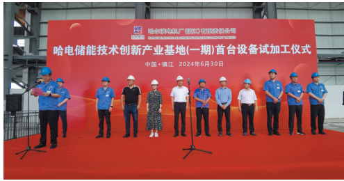
哈电储能技术创新产业基地项目一期首台设备试加工仪式在高新区成功举办。