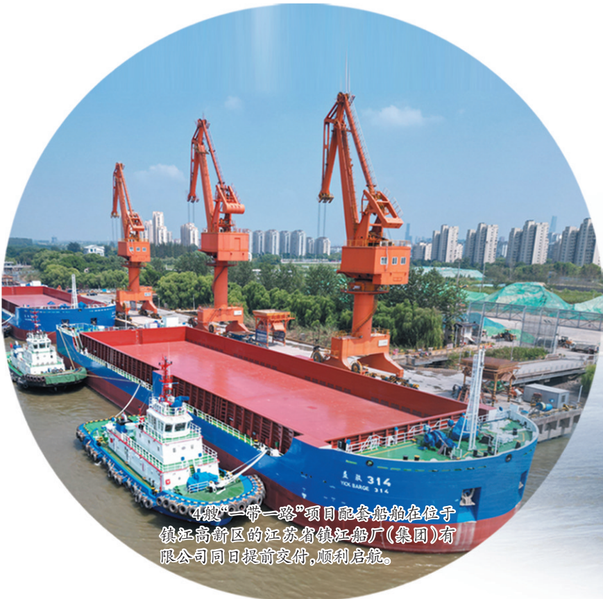
“中欧”一带一路项目配套船舶在位于镇江高新区的江苏省镇江船厂(集团)有限公司同日提前交付,顺利启航。