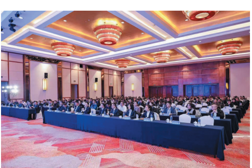
以“绿色·智慧·延伸人类力量”为主题的柳工高机新产品发布会在镇江成功举办。